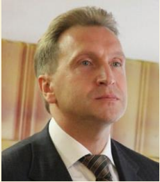
ШУВАЛОВ ИГОРЬ ИВАНОВИЧ Первый заместитель Председателя Правительства Российской Федерации