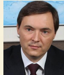
МОЛЧАНОВ АНДРЕЙ ЮРЬЕВИЧ Президент Национального объединения строителей