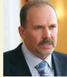
МЕНЬ МИХАИЛ АЛЕКСАНДРОВИЧ Министр строительства и жилищно- коммунального хозяйства Российской Федерации