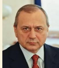
ШАККУМ МАРТИН ЛЮЦИАНОВИЧ Депутат Государственной Думы Федерального собрания Российской Федерации – Заместитель председателя комитета Государственной Думы по финансовому рынку