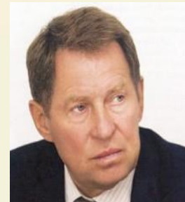
ЯКОВЛЕВ ВЛАДИМИР АНАТОЛЬЕВИЧ Президент Российского Союза строителей