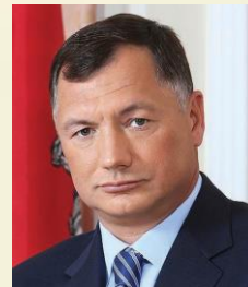
ХУСНУЛЛИН МАРАТ ШАКИРЗЯНОВИЧ Заместитель Мэра Москвы в Правительстве Москвы по вопросам градостроительной политики и строительства